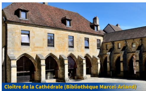
Cloître de la Cathédrale (Bibliothèque Marcel-Arland)