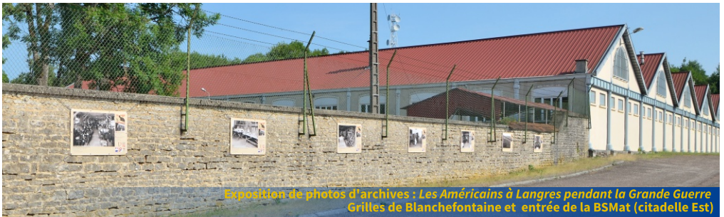
Exposition de photos d'archives : Les Américains à Langres pendant la Grande Guerre Grilles de Blanchefontaine et entrée de la BSMat (citadelle Est)

• Un ancien couvent de religieuses cloîtrées : les Annonciades célestes de Langres (Chapelle des Annonciades)