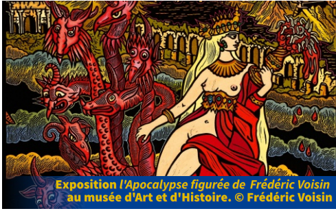
Exposition l'Apocalypse figurée de Frédéric Voisin au musée d'Art et d'Histoire. © Frédéric Voisin