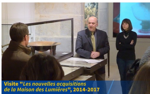
Visite "Les nouvelles acquisitions de la Maison des Lumières", 2014-2017