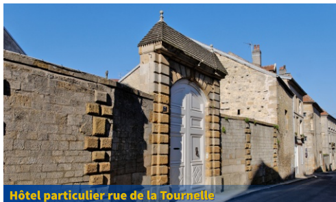
Hôtel particulier rue de la Tournelle