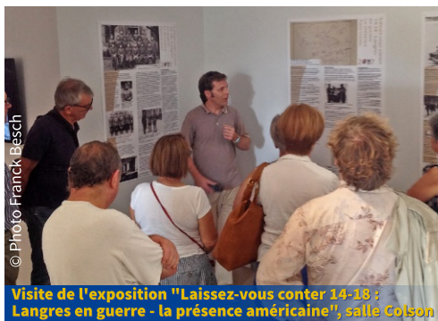
Visite de l'exposition "Laissez-vous conter 14-18 : Langres en guerre - la présence américaine", salle Colson

• Diaporama sonorisé et commenté sur "le style roman dans notre région" (RDV église de Brevoines).