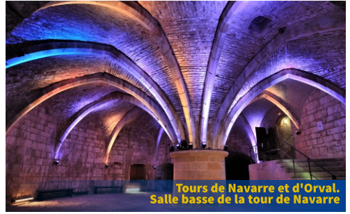
Tours de Navarre et d'Orval. Salle basse de la tour de Navarre