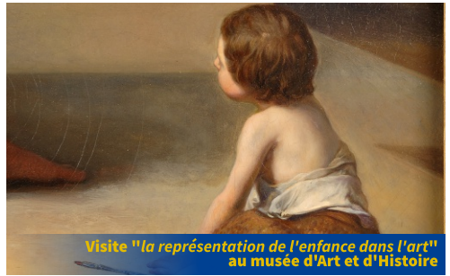
Visite "la représentation de l'enfance dans l'art" au musée d'Art et d'Histoire