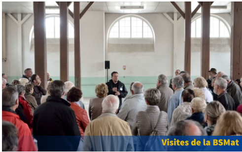
Visites de la BSMat