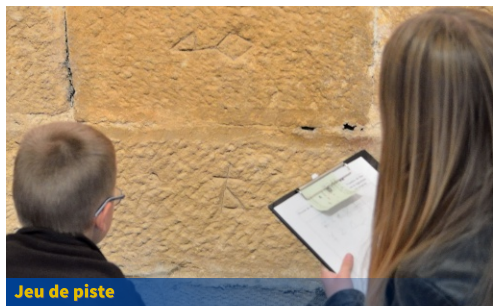
Jeu de piste