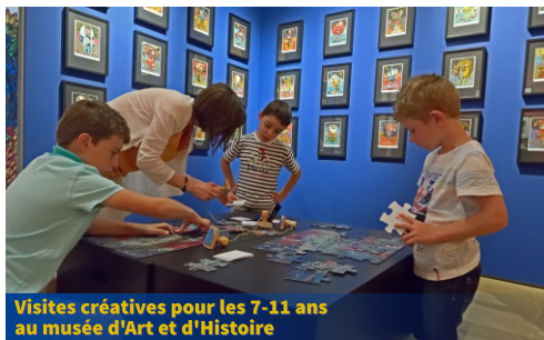
Visites créatives pour les 7-11 ans au musée d'Art et d'Histoire