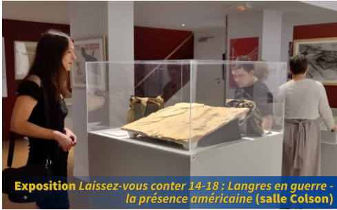
Exposition Laissez-vous conter 14-18 : Langres en guerre - la présence américaine (salle Colson)

• Laissez-vous conter 14-18 : Langres en guerre - La présence américaine (salle Colson – Maison des Lumières Denis Diderot)