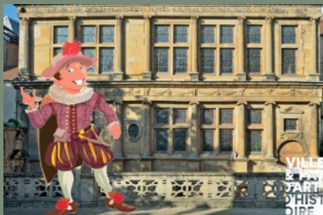
EXPLORATEURS Langres à la Renaissance

Visite ludique de l'exposition « Autre temps, autre mode ». Salle Colson (Maison des Lumières Denis Diderot).