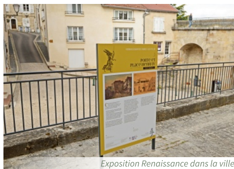
Exposition Renaissance dans la ville

Jules Hervé-Mathé et Jules-René Hervé : deux peintres, deux collections. Jules Hervé-Mathé (1868-1953) et Jules-René Hervé (1887-1981) sont des artistes issus de la même famille. Peintres de la couleur et de la lumière, ils s'intéressent à la vie quotidienne, aux petits et grands événements de la vie langroise, aux villages de Haute-Marne ou de la Sarthe, aux paysages de campagne... Musée d'Art et d'Histoire. Place du Centenaire.