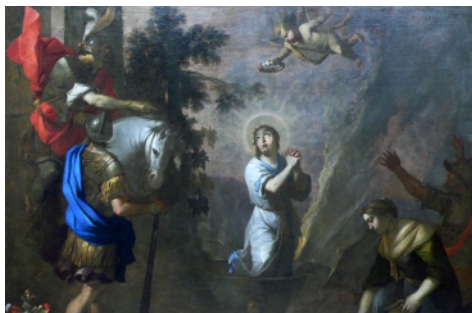
Tassel : Martyre de sainte Martine.