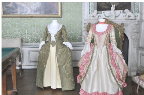
Exposition « Autre temps, autre mode »