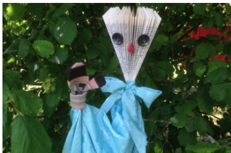
Atelier fabrication de marionnettes recyclées.