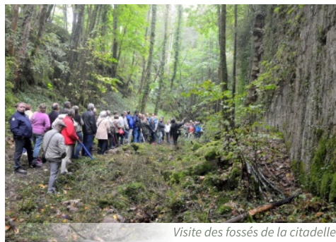
Visite des fossés de la citadelle