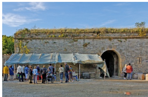
Taille de pierre à la Lunette 10