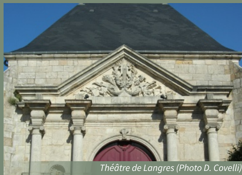
Théâtre de Langres

Les Journées Européennes du Patrimoine se tiendront cette année les 21 et 22 septembre autour du thème « Arts et divertissements » fixé par le Conseil de l'Europe et la Commission européenne et repris par la plupart des 50 États signataires de la Convention culturelle européenne.