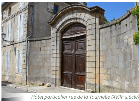
Hôtel particulier rue de la Tournelle (XVIII e siècle)