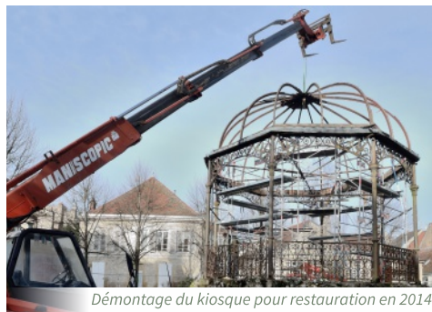
Démontage du kiosque pour restauration en 2014