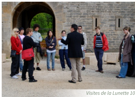
Visites de la Lunette 10